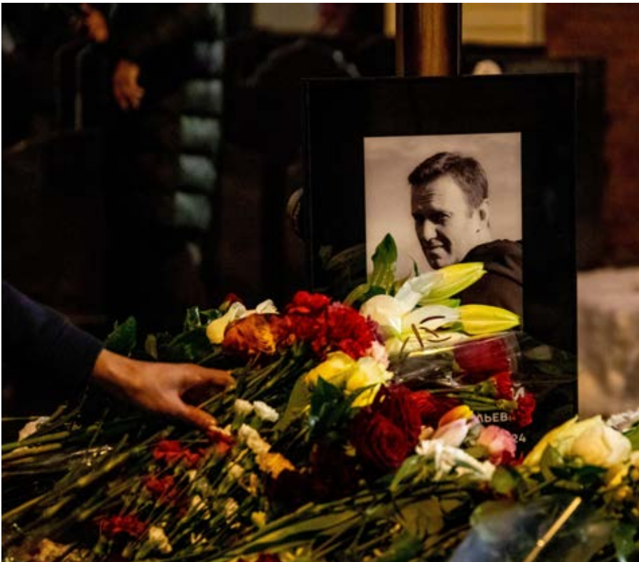
2024. gada 1. marts. Atvadīšanās no Krievijas opozīcijas līdera Alekseja Naļņija. Krievija, Maskava.

Sagaidāms, ka arī 2025. gadā procesi Krievijas iekšpolitikā būs pakārtoti Krievijas aizsardzības sektora vajadzībām, lai nodrošinātu bruņotos spēkus ar nepieciešamo bruņojumu un ekipējumu karam Ukrainā, kā arī Krievijas militāro spēju atjaunošanai pēc potenciālām miera sarunām. Šī mērķa sasniegšanai turpināsies plašas represijas pret opozīcijas pārstāvjiem un sabiedrību, lai novērstu V. Putina režīmam kritisku viedokļu plašāku izplatību un iespējamu sabiedrības mobilizāciju pret režīmu. Tā vietā sabiedrība arī turpmāk tiks konsolidēta režīma atbalstam, izmantojot pēdējos gados izveidotos un nostiprinātos propagandas mehānismus, tai skaitā uzturot Krievijas ārējā apdraudējuma vēstījumus.